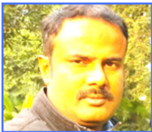
महादेव कुमार सिंह भोजपुरी कहानी

एही बीच भेदिया के मन में पाप घूस गईल ऊ सोचलस कि साहेब से आपन दोस्त के जान-पहचान कराके अच्छा नईखे भईला। ऊ तुरंते आपन दोस्त से कहलस -"तनिक बाहर जा, अवे आवतानी,, एतना सुनला पर भेदिया के दोस्त के माथा ठनकल ऊ सोचलस कि कुछ त गडबड बा! तब ऊ धीरे से बाहर निकल गईल आऊर कोना मे खड़ा होके भेदिया के दोमुहाँपन के समझे के परयास कईलस। भेदिया के दोस्त के अईसन महसूस भईल कि भेदिया आपन साहेब के कहता कि- साहेब जी हम त अईसही आ गईनी ह, अभी जौना आदमी आईल रहे बड़ उदंड टाईप के बा, अईसन के मदत कईला से कऊनो फायदा नईखे, बड़ परशान कईले रहे एही खतिरा आ गईल रही। भेदिया के दोस्त जब भेदिया के बात सुनलस तब ओकर तरबक लहर कपार पर चढ़ गईला। ऊ धीरे से ऊहाँ से निकल गईल आज ओकराके अपने आप पर बड़ शरमिंदगी महसूस भईल आऊर तबे से लऊटके ऊ फेर कबो भेदिया के पास नईखे गईला कबो आमना-सामना भईला पर भी अईसन लागत रहे जईसे कि दूनो के बीच दूर- दूर तक के कोई जान-पहचान नईखे। ई बात सौ आना सच बा कि चमचागिरी से भी जादा खतरनाक दोमुहाँपन होला, बाकी जेकरा में दूनो अवगुण होई ऊ महा- शातिर आदमी होला। आज भेदिया के पाँचो अँऊरी घीऊ में बा, पढल-लिखल आदमी ओकरा से दूरी बनवले बा लेकिन कुछ लोग अईसन वारन जे भेदिया के खूब गुणगान करेलन।